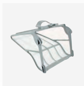
Filterkorb (60µ) Leicht zugänglich und mit großem Fassungsvermögen (5 Liter)